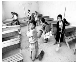
Buscamos Equidad, Justicia y Derechos Humanos, ser escuchados, atendidos, amados y respetados porque somos importantes en el desarrollo del ser humano, que ahora es más des-

3.- Proponer mecanismos y acciones en la definición de las políticas públicas que se cristalicen en la disminución de la desigualdad e igualdad de oportunidades para acceder a mínimos de bienestar (alimentación, educación, equidad, justicia, salud, trabajo, vivienda digna, etc.), ampliando las capacidades para lograr un desarrollo humano sustentable buscando disminuir los desequilibrios regionales que impiden el progreso.... (más información la página de Internet)