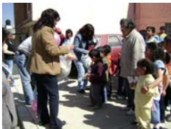
Entrega de dulces, gelatinas y juguetes por el Día de Reyes

Constituye el objeto de la Asociación la promoción de la participación organizada de la población y de lo socios en la realización de actos o decisiones en las acciones identificadas como del Estado para satisfacer un rango de necesidades que el mercado no satisface o no puede satisfacer para sectores numéricamente importantes de la población, es por ello que la Asociación busca mejorar la distribución de activos como alimentación, educación, salud, trabajo, vivienda digna, etc., a favor de los grupos vulnerables y sectores de la población más desfavorecidos, que les permitan mejorar sus propias condiciones de subsistencia y bienestar bajo un ambiente de equidad de género en donde se evite la discriminación y se promueva la equidad.